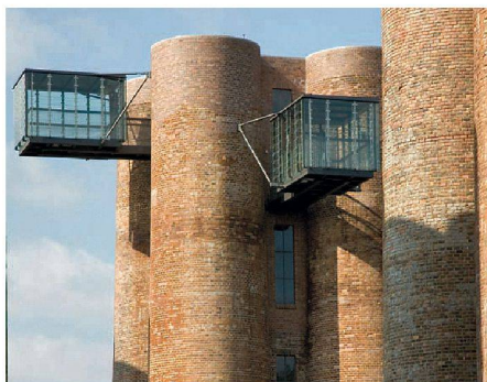
02 Ehemals Teil der Braunkohlegrosskokerei, heute touristische Attraktion