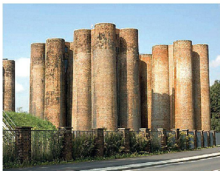
01 Die Biotürme in Lauchhammer erinnern an das Castel del Monte in Italien