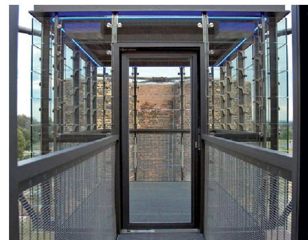
03 Der Anbau der Aussichtskanzeln wurde im Rahmen der IBA Fürst-Pückler-Land realisiert

Die Biotürme erinnern als einzige Bauten an die Braunkohlegrosskokerei im sächsischen Lauchhammer. Sie sind ein Projekt der Internationalen Bauausstellung (IBA) Fürst-Pückler-Land 2010.