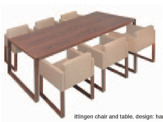
ittingen chair and table, design: harder spreymann, 2009