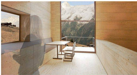
02 «Plan B»: flexible Geschossdecken