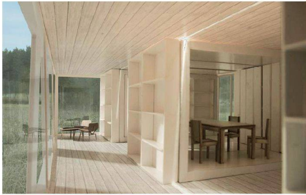
01 «inter pares»: verschiebbare Raumelemente