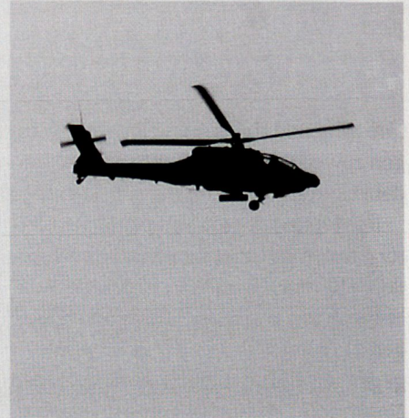
Amerikanischer Kampfhelikopter Apache AH-64.