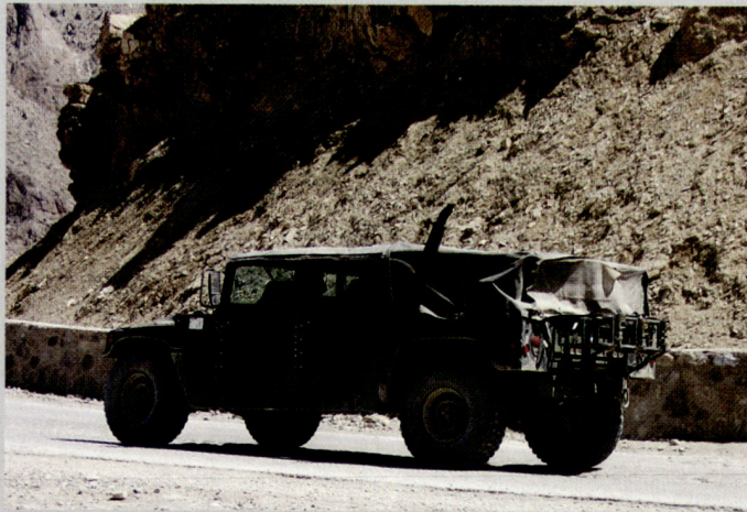
Ein Humvee eines amerikanischen Kon- vois auf dem Tera-Pass (Gardez-Kabul).

auch schwierig, zwischen Besatzungs- macht und Wiederaufbauhilfe zu unter- scheiden. Den Beweis dazu, dass es sich in beiden Fällen um Letzteres handelt (han- deln muss!), müssen die Interventions- streitkräfte bzw. deren Staaten in jedem Falle aber selbst erbringen. Und das wie- derum ist ein grundsätzliches Dilemma für humanitäre Einsätze von Streitkräf- ten. ■