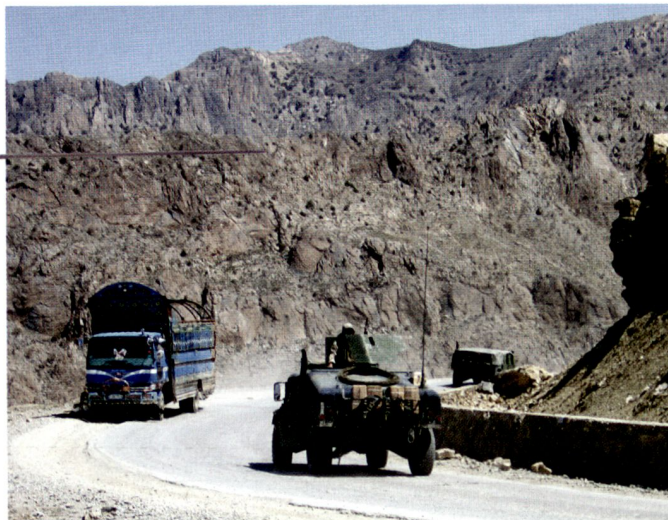
Kommando- und Sicherungsfahrzeug eines amerikanischen Konvois (Gardez–Kabul).

täre Hilfe und militärische Besatzung liegen zuweilen näher beieinander, als man denkt.