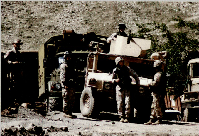
Bodyguards für ein amerikanischer Unter- händler im Panjshir-Tal, links ein CIA-Agent.