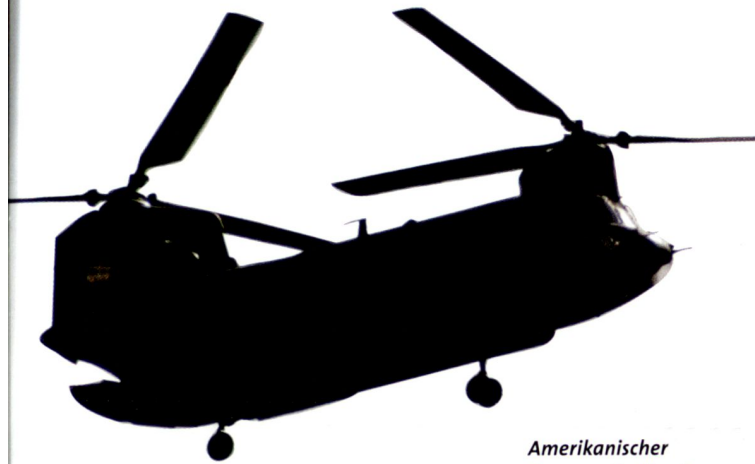
Amerikanischer Transporthelikopter Chinook CH-47.