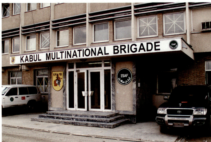
Kabul Multinational Brigade.

Wie dem auch sei: Für die Bevölkerung ist es schwierig, zwischen Soldaten, die gegen ihre Landsleute kämpfen, und Soldaten, welche sie beschützen wollen, zu unterscheiden. Für die Bevölkerung ist es