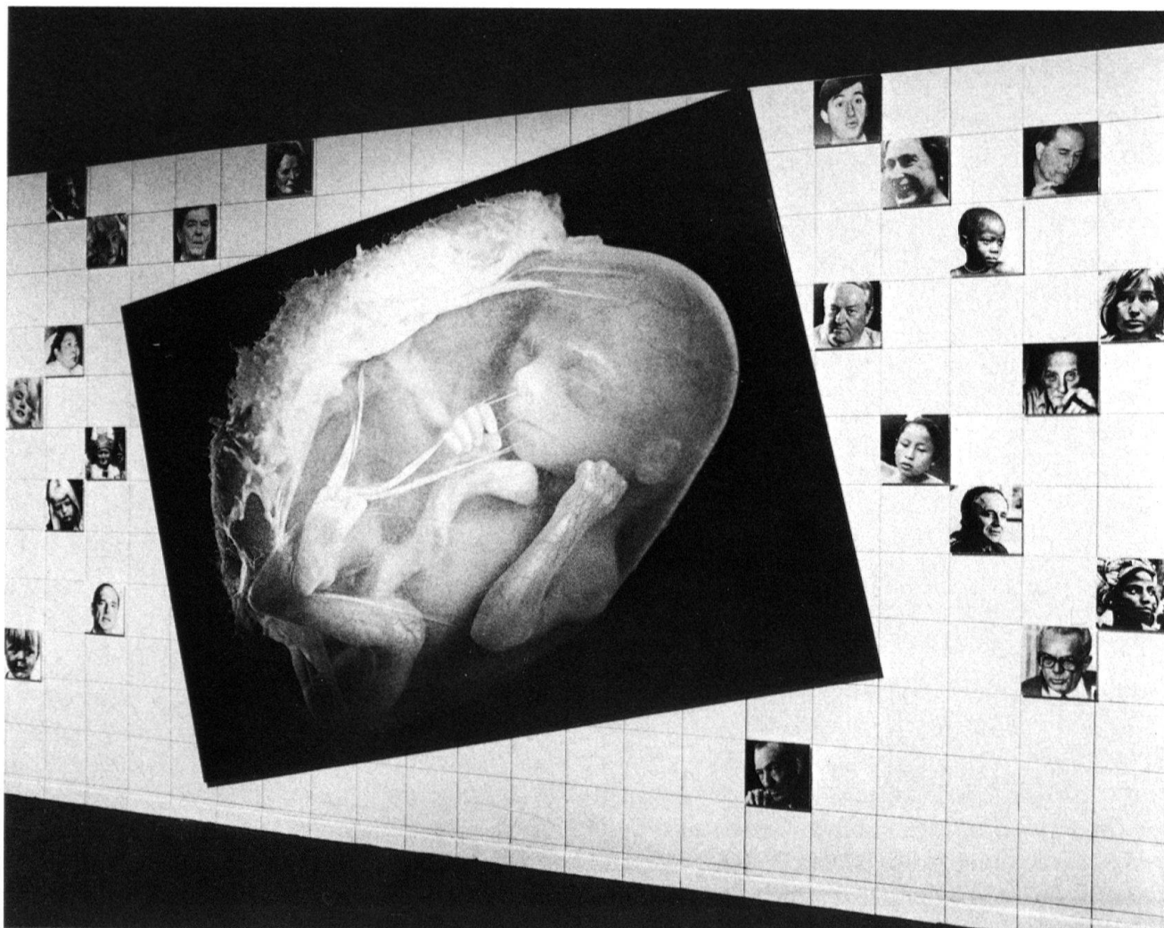
5 Naissance. Et lui? Ce fœtus dans son liquide amniotique nous rappelle le perpétuel renouvellement. Dans quelles conditions?