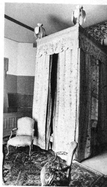
2 Lit à baldaquin Louis XVI en soie peinte, provenant du château de Grignan (Drôme), fauteuils Louis XV d'origine, dans le décor reconstitué d'une chambre à coucher entièrement tendue de soie.

L'existence de nouvelles muséologies postule au moins une muséologie traditionnelle, celle qui consiste à présenter aux visiteurs des objets rares et précieux. Conservés, c'est-à-dire mis hors du