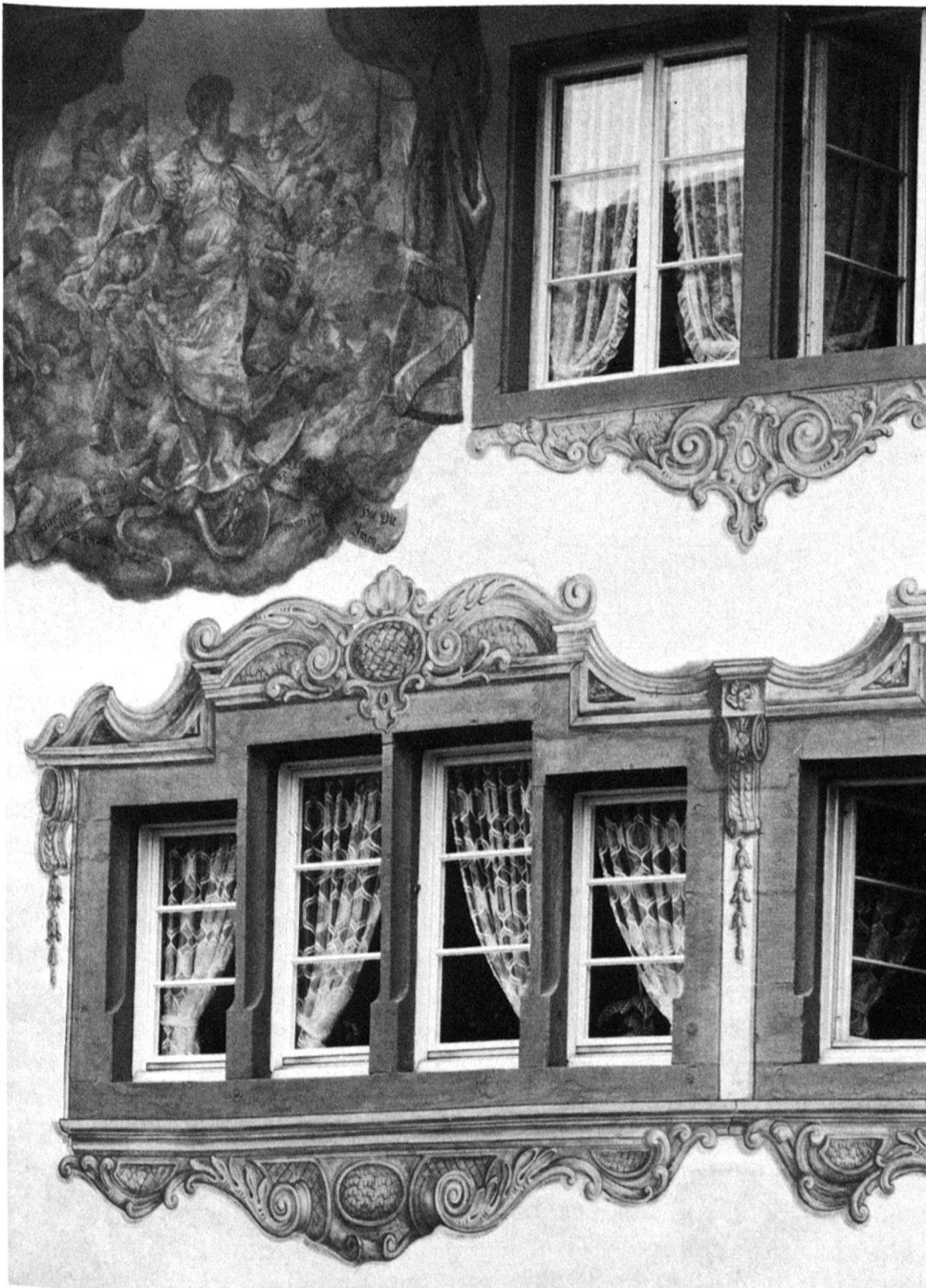
1 Diessenhofen, Klosterhaus. Grisaille-Bemalung um die Fenster und Gemälde von Jacob Carl Stauder.

Wenige, kaum deutbare Malereifragmente haben sich an einem Pfeiler der Stadtkirche St. Dionys erhalten. Ihrem Platz in der Baugeschichte gemäss müssten sie zur Spätgotik gezählt werden 1 .