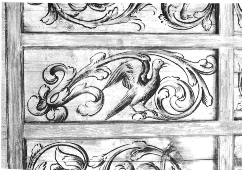
3 Diessenhofen, Deckenfeld aus der «Alten Krone», heute im Historischen Museum in Frauenfeld.

drei weiteren Häusern vorhanden, so im heutigen Café Altstadt (Hauptstrasse 19: Reste einer Jagdszene und eines Hauspruchs) 7 und im Haus «Goldene Saul» (Hauptstrasse 17) 8 . Sie sind jedoch verschwunden. Dass aber in jenem Zeitraum im Rheinstädtchen des öftern gemalt wurde, ist auch durch Archivalien belegt. Beispielsweise erhielt beim Neubau des Siegelturms Meister Max Wischack (geboren um 1500 in Schaffhausen, gestorben vor 1556 wahrscheinlich in Basel) im Jahre 1546 eine Bezahlung von 50 Florin für Malereien, von denen wahrscheinlich noch geringe Randspuren vorhanden sind 9 . Der vielseitig tätige Pfarrer Johann Mentzinger 10 (1604–1668) – erschuf unter anderem auch den berühmten «Merian»-Stich von Diessenhofen – brachte an verschiedenen Orten Sonnenuhren an, deren «Zifferblatt» bei dieser Gelegenheit renoviert oder neu gemalt wurde, so 1642 an der Helferei (Helfereigasse 10), 1652 am evangelischen Pfarrhaus (heute Gemeindehaus, Hauptstrasse 1), 1649 an Kirche und Beinhaus, 1663 am Siegelturm.