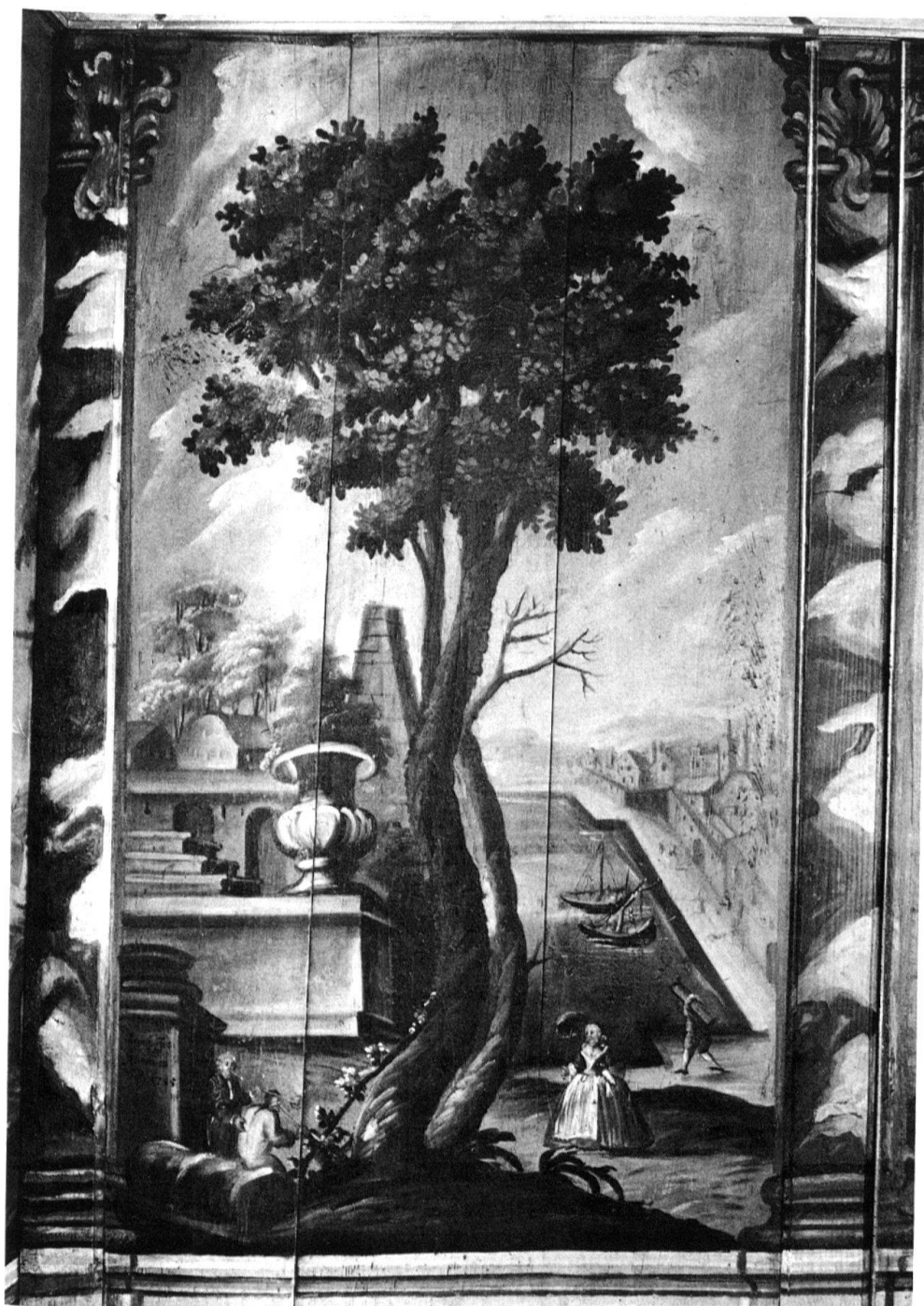
6 Diessenhofen, Wandtäfer aus dem «Löwen», heute im Historischen Museum in Frauenfeld. Landschaftsmalerei von Franz Joseph Stark, signiert und datiert.

Sehr wenig weiss man bisher über die Diessenhofer Fassadendekorationen und gemalten Interieurs aus dem 19. Jahrhundert. Doch kommen nach und nach bei Restaurierungen sehr fein abgestufte Flächenmalereien, gekonnte Holzimitationen an Täfern und Decken sowie bedeutende Tapetenreste zum Vorschein. Dabei ist daran zu erinnern, dass Diessenhofen im 19. Jahrhundert Höhepunkte der Stoff-Färberei und -Druckerei erlebte.