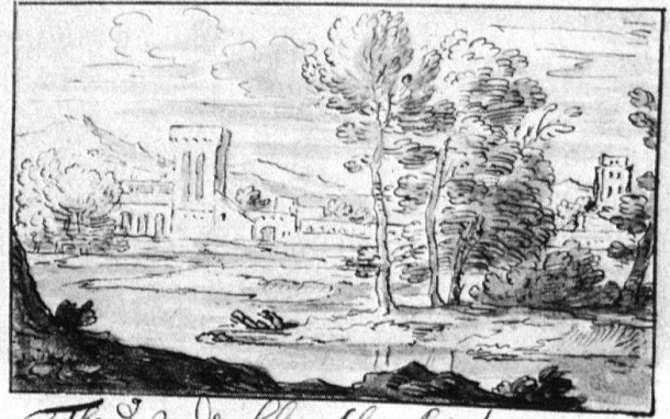
Theod. van der Scheide Alias Amicitia, et amicitiae Causa fecit A o 1681

sermeister, in der Stadt wirkte, der liess fremde Künstler bestenfalls unter sich oder für sich, niemals neben sich, in Stuck arbeiten.