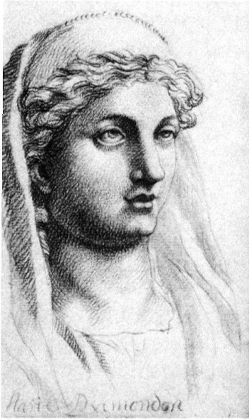
1 Stammbuch Laurenz von Waldkirch, Bürger, Künstler und Verleger von Schaffhausen (1659–1707). (Standort: Stadtbibliothek Schaffhausen JGM 433.) Alle Abbildungen sind diesem ledergebundenen und vollständig erhaltenen Stammbuch entnommen, dessen Einträge von 1675 bis 1681 datiert sind. Das Porträt «Marie Ramondon» in Rötzelzeichnung muss entweder von der Hand der Dargestellten oder vom Besitzer des Stammbuchs selbst stammen (Bordeaux, 28. März 1680).

spielt wird, und dies besonders von Schaffhauser Vettern und Freunden, lässt verschiedene Schlüsse zu. Dieser Stammbuchbesitzer pflegte überwiegend Freunde und Reisegefährten, darunter Künstler und Kaufleute, einzuladen, sich in sein Buch einzutragen. Als Künstler war er vor allem für seine Mitbürger eine bemerkenswerte, für seine Zeit und diesen Ort neue Erscheinung. – Die Schaffhauser Ärzteschule des 17. Jahrhunderts umfasste mehrere Generationen und war über die Landesgrenzen hinaus im süddeutschen Raum erfolgreich und berühmt. – Auf diesem Hintergrund wirkt die Stammbuch-Geschichte, die der Schaffhauser Johann Wilhelm Im Thurn am 19. März 1681 erzählt und gedeutet hat, um so erstaunlicher. Nebst lateinischen und deutschen Sprüchen («Die Kunst die zuletzt gelernt u. getrieben wird, ist die grösste, Namlich wol sterben») erzählt er auf französisch vom König Bogaris, der durch die Kunst eines kriegsgefangenen Künstlers bekehrt wurde, und setzt ebenfalls auf französisch die Moral gleich dazu (übersetzt): «Diese Geschichte zeigt Ihnen, mein sehr lieber Vetter, dass die Kunst der Malerei vortrefflicher ist als diejenige der Medizin, weil sie die Krankheit der Seele heilen kann (oben haben Sie ein Beispiel davon) und die andere (die Medizin) nur diejenige des Körpers.»