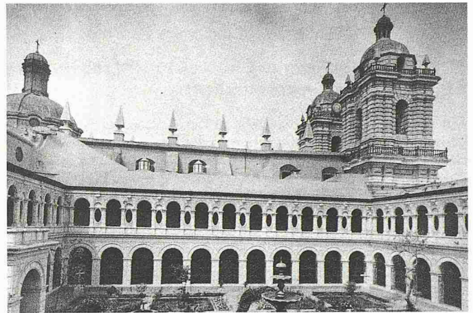
Der Innenhof des Hauptklosters wurde wie die Kirche in den Jahren 1669–74 errichtet