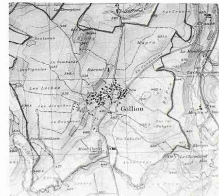
Die waadtländische Gemeinde Gollion in der vertrauten Darstellung der Landeskarte 1:25 000

von Einzelwerten, die vom Satelliten kommen, durch mathematische Verarbeitung in eine «anschauliche» Form bringen. Die Forscher der ETH Lausanne (Institut für Kulturtechnik und Vermessung, Prof. A. Musy) entwickeln deshalb Verfahren zur numerischen Aufarbeitung der von SPOT und LANDSAT gelieferten Daten. Es geht darum, sie zu «kalibrieren», die Zeitunterschiede zu korrigieren und die cha-