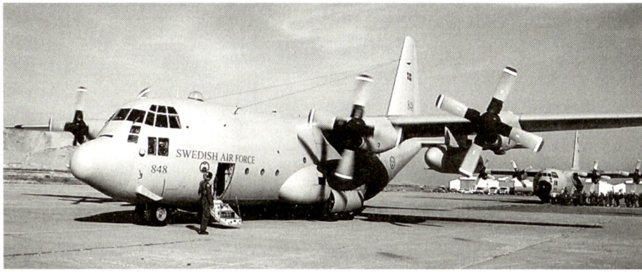
Schwedische C-130 Hercules auf dem Flughafen von Kabul. Ende 2004 unterstützte das Transportkommando der schwedischen Luftwaffe die Operation der ISAF in Afghanistan.

Nach dem Ende des Kalten Krieges fuhr die schwedische Luftwaffe fort, den nationalen Luftraum rund um die Uhr zu überwachen. Die Zahl der militärischen Flüge über der Ostsee konnte jedoch erheblich reduziert werden. Schwedische Kampfflugzeuge werden gleichwohl weiterhin in Bereitschaft gehalten. Besonders im Zeitalter der asymmetrischen Bedrohungen ist dies von ausserordentlicher Bedeutung. Obwohl die schwedische Luftwaffe über die Fähigkeit verfügt, so genannte nichtmilitärische Flugzeuge abzufangen, gibt es noch keine klaren Einsatzregeln, um gegen asymmetrische Bedrohungsformen aus der Luft vorzugehen. 9 Trotz dieser unklaren juristischen Situation patrouillierten schwedische Jagdflugzeuge während wichtiger Anlässe wie des EU-Gipfels von Göteborg 2001 oder der Gedenkveranstaltung für die ermordete schwedische Aussenministerin, Annah Lindh. 10