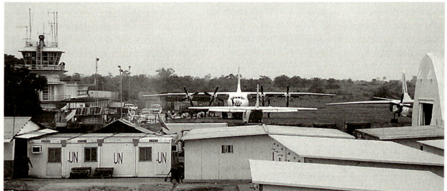
Von Juni 2003 bis Juni 2004 betrieb eine schwedische Flughafeneinheit den Flughafen in Kindu. Dies war ein äusserst wichtiger Beitrag an die Operation MONUC in der Demokratischen Republik Kongo.