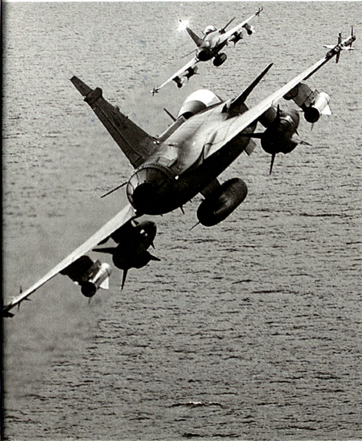
JAS 39 Gripen, bewaffnet mit Maverick-Luft-Boden-Raketen und RBS 15 Anti-Schiffsflugkörpern. Diese Bewaffnung wäre geeignet gewesen, um eine Invasion von See her abzuwehren.

gen und Estland gemeinsam eine multinationale Kampfgruppe, basierend auf dem EU-Battle-Group-Konzept, aufstellen werden. Als Leitnation übernimmt Schweden die Hauptverantwortung für diese Krisenreaktionsstreitmacht und stellt das grösste Truppenkontingent. Die nordische Kampfgruppe wird vom 1. Januar bis zum 30. Juni 2008 in erhöhter Bereitschaft stehen. 55