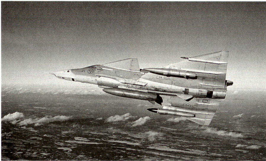
Abgebildet ist eine kampfwertgesteigerte AJF37 Viggen. Diese Maschinen bildeten das Kernstück der ersten Krisenreaktionseinheit der schwedischen Luftwaffe. Sie waren von 2001 bis Ende 2003 auf stand-by und hätten jederzeit in eine Krisenregion entsandt werden können.

Bomben sowie Laserdesignatoren beschafft. 71 Eine Fähigkeit zur Luftnahunterstützung erfordert auch Beobachter am Boden. Bereits im Jahr 1999 begannen die schwedischen Streitkräfte damit, so genannte Forward Air Controllers (FAC) 72 gemäss NATO-Standard auszubilden. 73 Die schwedische Luftwaffe wird somit in der Lage sein, in friedensunterstützenden Operationen über das ganze militärische Gewaltenspektrum zu wirken, eine Fähigkeit, welche im Begriffe ist, zu einer internationalen Norm zu werden.