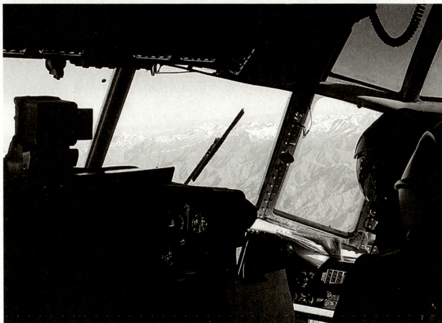
Eine C-130 Hercules überquert das Hindukusch-Gebirge, welches Afghanistan teilt.

Das Jahr 1999 stellte einen Wendepunkt in der Ausrichtung der schwedischen Verteidigungspolitik dar. Auf europäischer Ebene gab es zwei Ereignisse, welche auch Schweden nicht unberührt liessen. Erstens brachte die Kosovokrise die veralteten Verteidigungsstrukturen Europas zu Tage. Zweitens gelangten die EU-Mitgliedstaaten am Europäischen Rat in Köln zur ge-