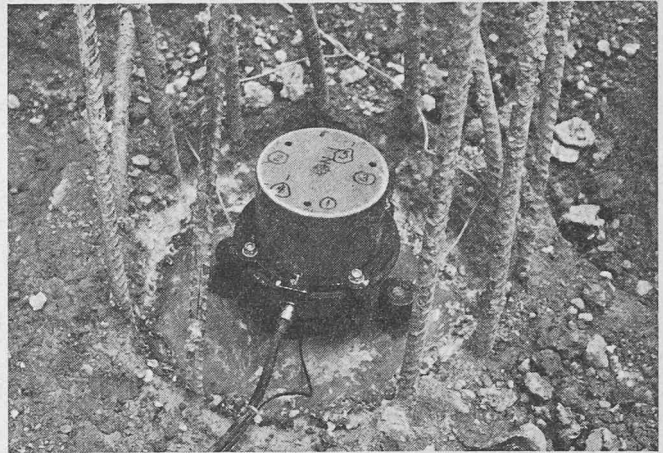
Vibrationsmethode: Vibrator und Beschleunigungsmesser

Durch kontinuierliche Registrierung der mechanischen Impedanz in einem gewissen Frequenzbereich lassen sich die oben geschilderten Fehlstellen oder Materialmängel feststellen. Die