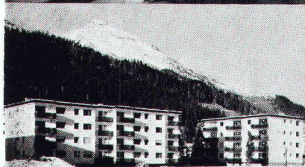
Überbauung Rietstrasse, Elektrizitätswerk der Landschaft Davos; total 33 Wohnungen; Anschlusswert ca. 400 kW