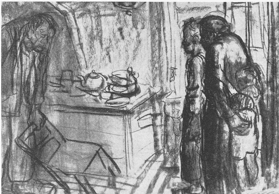
Käthe Kollwitz: «Trinker bedroht Familie»

Heinrich Zille (1885–1929). In volkstümlich humoristischen und zugleich satirisch anklagenden Zeichnungen schilderte er das «Milljöh» des Berliner Proletariats. «Vater Zille» genoss grosse Popularität über die Elendsquartiere hinaus, wo er sein einfaches, arbeitsames Leben grösstenteils in einer zweifenstrigen Stube beim Bahnhof Westend verbrachte. Als Autodidakt gewann der Zeichner und Maler Zille (später Mitglied der Akademie) bedeutendes Ansehen. Hierzu trug auch seine Mitarbeit für die «Jugend», den «Simplicissimus» und andere illustrierte Blätter bei.