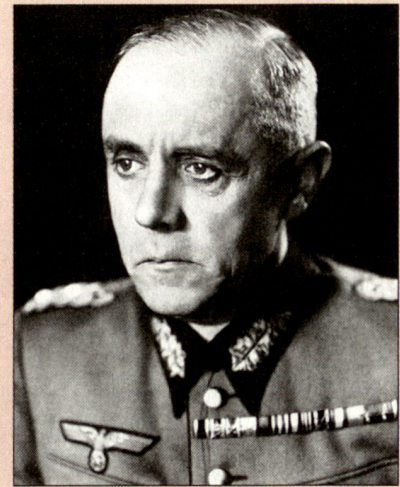
Generaloberst Ludwig Beck (1880–1944), Generalstabschef des deutschen Heeres 1935–1938. Bekannt durch seine Beteiligung am Widerstand gegen Hitler. Er verkörperte bedingungslos militärische Tugenden. Insbesondere prägte er Generationen von Generalstabsoffizieren in der Klarheit des Denkens, der Sprache und des aufopfernden Arbeitens. Von ihm stammt der Ausspruch: Wer klare Begriffe hat, kann führen. AM Bild: Buchheit Gert, Ludwig Beck, ein preussischer General, München 1964, Vorsatzblatt.