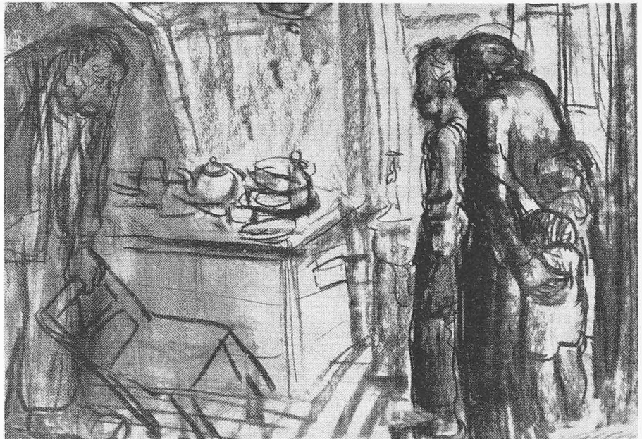
Käthe Kollwitz: «Trinker bedroht Familie»

Heinrich Zille (1885–1929). In volkstümlich humoristischen und zugleich satirisch anklagenden Zeichnungen schilderte er das «Milljöh» des Berliner Proletariats. «Vater Zille» genoss grosse Popularität über die Elendsquartiere hinaus, wo er sein einfaches, arbeitsames Leben grösstenteils in einer zweifelhafte Stube beim Bahnhof Westend verbrachte. Als Autodidakt gewann der Zeichner und Maler Zille (später Mitglied der Akademie) bedeutendes Ansehen. Hierzu trug auch seine Mitarbeit für die «Jugend», den «Simplicissimus» und andere illustrierte Blätter bei.