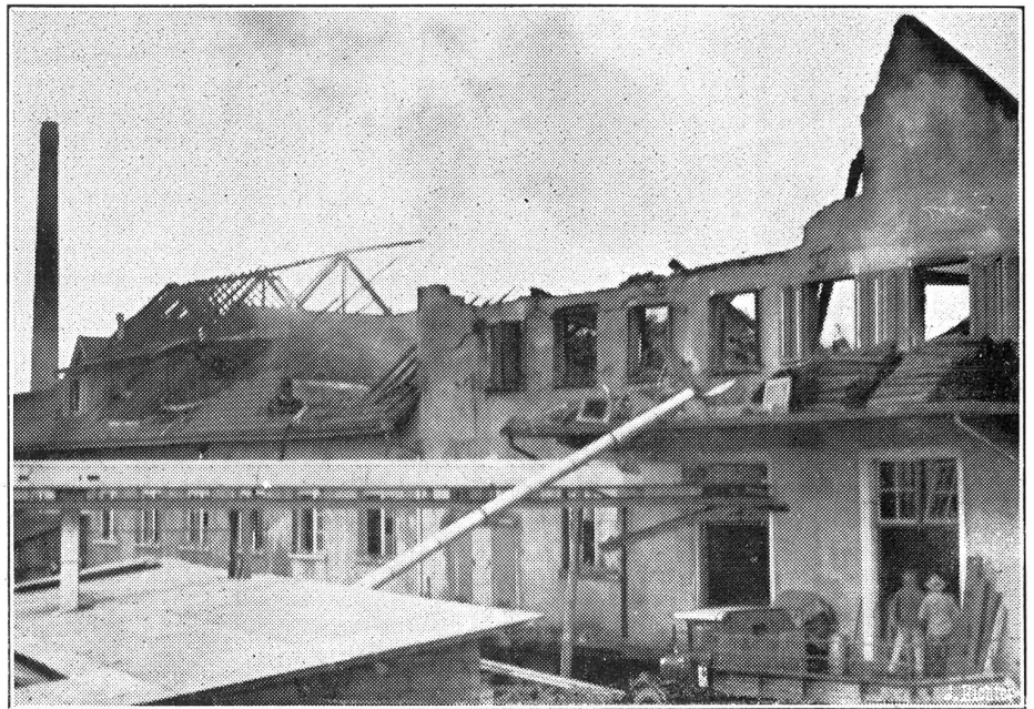
Grossbrand in Bischofszell.