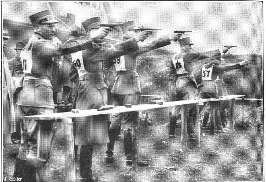
Abschluss der 1. Schweiz. Armeemeisterschaft im modernen Fünf- und Dreikampf.

Im Oktober erreichten die Zolleinkünfte den Betrag von 20,2 Mill. Fr. gegen 22,8 im Oktober des Vorjahres. Die Stempelabgaben dagegen erreich-