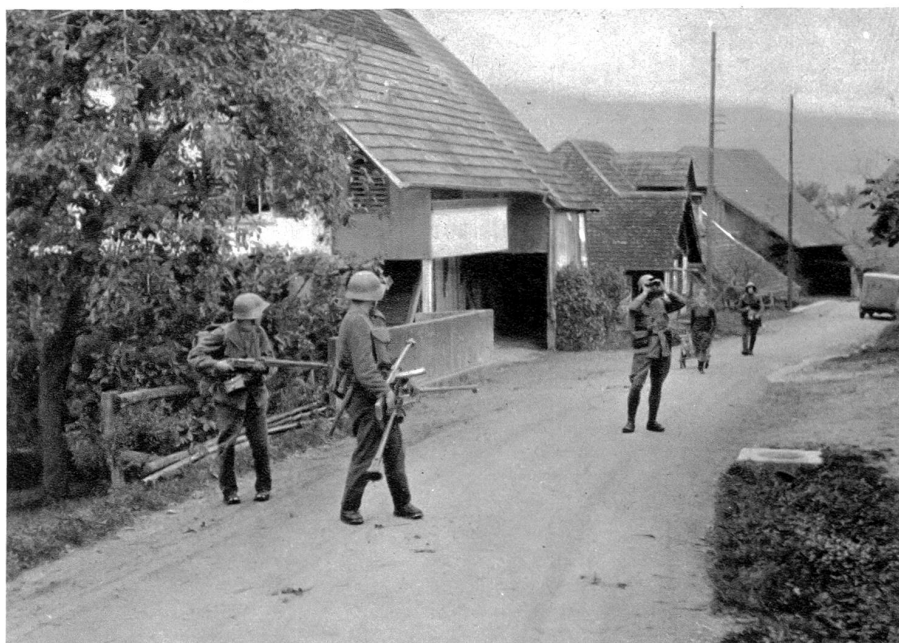
Manöver? Die heutige „Leere des Schlachtfeldes“. L.M.G. geht in Stellung