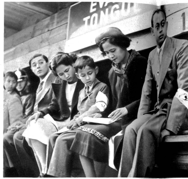
Verwante und Bekannte vom siamesischen Rennfahrer Prinz Bira verfolgen die Zeiten der Rennfahrer