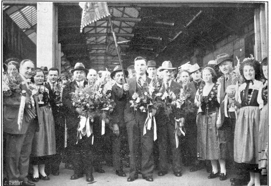
Begeisterter Empfang unserer Matcheschützen in Zürich.