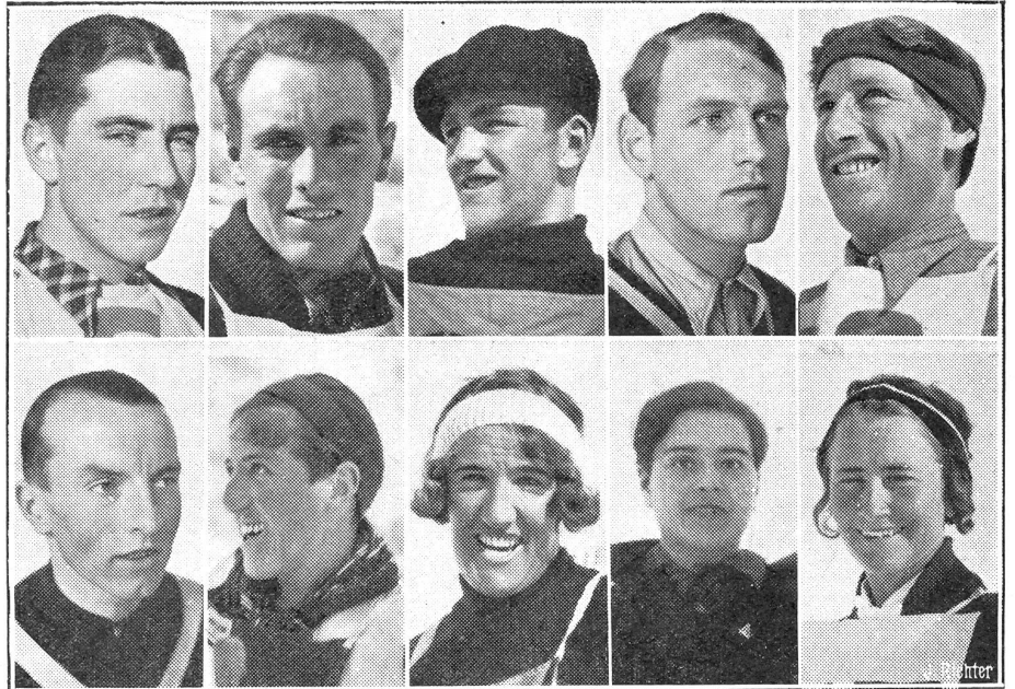
Schweiz. Skirennen in Les Diablerets.

Wie der Bundesrat mitteilt, waren die hauptsächlichsten Einnahmen des Bundes im Jahre 1936: Zolleinnahmen, ohne Erträgnisse aus Tabak- und Getränkesteuer Fr. 256 480 761 (gegen Fr. 266 953 661 im Jahre 1935); Tabak- und Getränkesteuer: Fr. 41 384 492 (Fr. 41 284 433 im Jahre 1935); Erhöhte Getränkesteuer: Fr. 19 200 126 (16 435 684 im Vorjahre); Stempelabgaben: Fr. 43 200 000 (43,8 Millionen im Vorjahre).