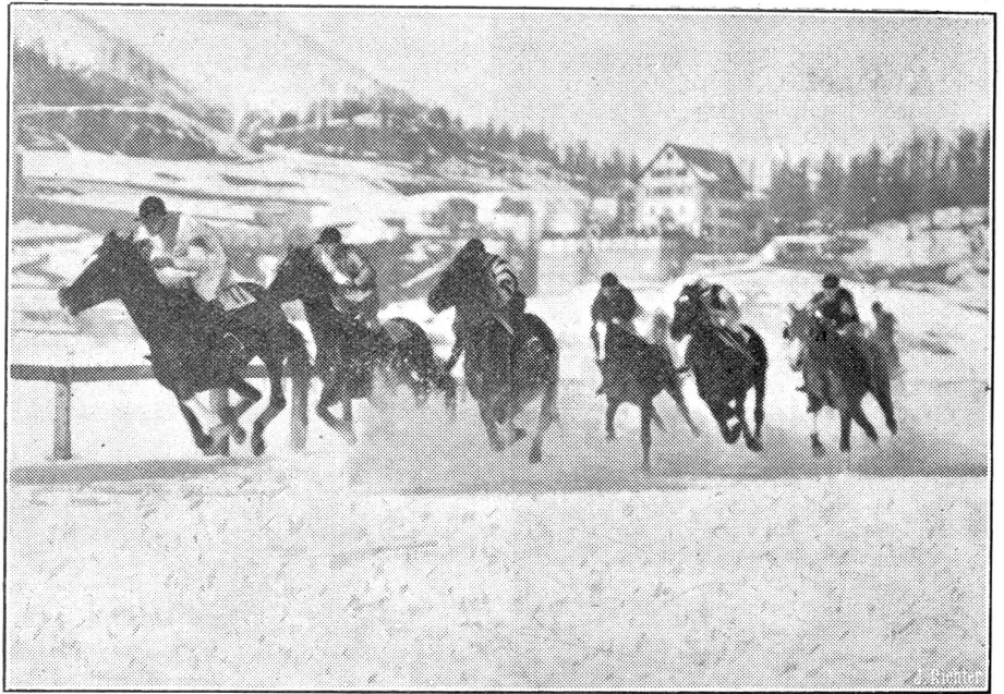
Vor der grossen Rennwoche in St. Moritz.

Es scheint fast, als würden wir wieder ganz in das Zeitalter der Mystik hineinkommen, denn es geschehen derzeit fortwährend ganz miraculöse Dinge, die sich schwer auf natürlichem Wege erklären lassen. So gehen wir z. B. seit Wochen mit Riesenschritten dem Frühling entgegen, ohne daß wir ihm auch nur einen Schritt näher kämen, trotzdem andererseits wieder gar keine Rückschläge in den Winter vorhanden sind. Ähnlich verhält sich die Geschichte mit unserem Franken, der, trotzdem er ein Franken geblieben ist, schon lange keinen Franken mehr wert ist, da sich außer allen anderen Waren sogar der doch auf den abgewerteten Franken zugeschnittene Bundesgugelhopf, das Vollbrot, verteuerte. Und Hitler hielt eine zweistündige Rede, aus der es wirklich schwer werden dürfte, Kriegsdrohungen heraus zu kristallisieren, wenn man nicht etwa die Verneinung der „Kriegsschuldfrage“, bitte Kriegsschuld- nicht Kriegsschuldenfrage, als „casus belli“ bezeichnen will oder am Ende die Erklärung, daß es zwischen Deutschland und Frank-