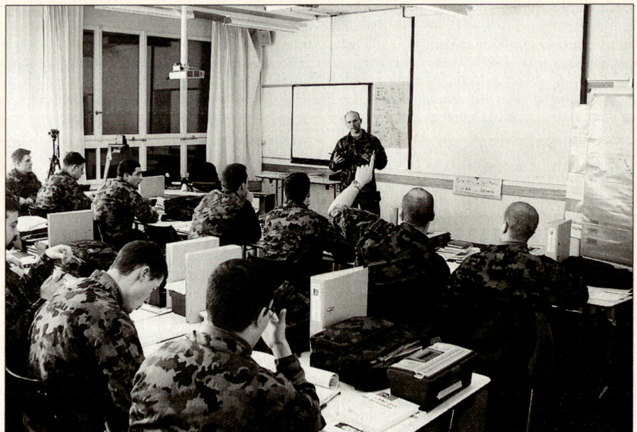
Kommunikationsausbildung, ein Ausbildungsschwergewicht im Of LG.

Im Of LG werden das Modul Kommunikation und Information abgeschlossen und drei weitere Module fortgesetzt und mit Zwischenprüfungen ausgewiesen. In der Kommunikationsausbildung wird der Lehrkörper durch kompetente Trainer des Zentrums für Informations- und Kommunikationsausbildung (ZIKA) verstärkt. Es handelt sich dabei um ausgewählte AdA (Kader und Soldaten), die auf Grund ihrer zivilen Tätigkeit für diese Ausbildung prädestiniert sind.