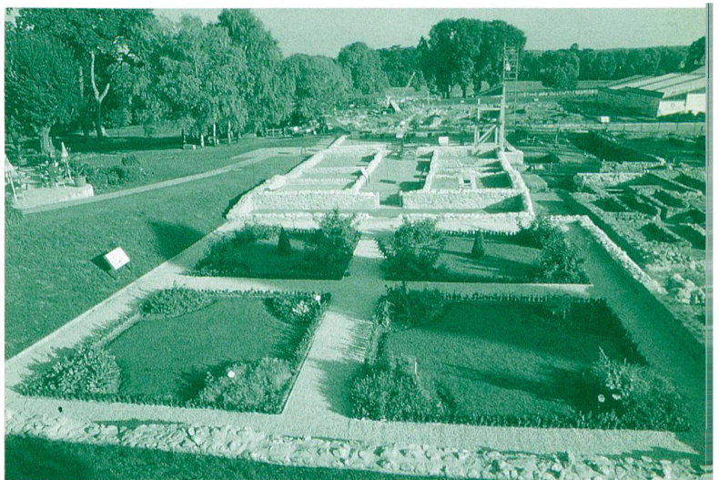
Abb. 2: Gesamtansicht des Gartens und des Hauses I gegen Norden.

Mit Ausnahme dieser beiden Buchsbaumsolitäre ist das Innere aller vier Grünflächen nur mit dem schon in römischen Gärten vorhandenen Rasen bepflanzt 10 . Als Beete für