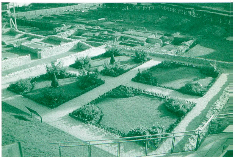
Abb. 3: Gesamtansicht des Gartens gegen Osten.