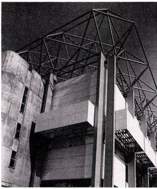
1 Eckdetail der Ringerhalle. 2 Die Ringerhalle. Ansicht von der Straße her.