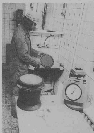
Neuer Luftgehaltsprüfer Porotest für Beton. Alle Bedienelemente, das grossflächige Manometer und eine Wasserkammer sind in den kompakten Gerätekopf eingebaut, der durch zwei Schnellverschlüsse mit dem Probenbehälter verspannt wird

gen verdreifacht wurde. Bei einer Betätigungskraft von etwa 0,08 kN (8 kp) ist die Druckkammer bereits mit sechs Kolbenhüben gefüllt; der Kammerdruck wird dann durch Betätigen eines Fingertip-Ventils auf die Prüfmarke eingestellt.