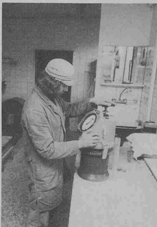
Statt des Gerätekopfes braucht nach der Prüfung nur der Behälter-Zwischendeckel gereinigt werden. Wie der Probenbehälter besteht er aus hochfestem Polyamid, die Betonreste lassen sich leicht abschwemmen

(vvp). Im Zusammenhang mit der wirtschaftlich dringend notwendigen Produktivitätssteigerung im Stahlwerk Gerlafingen der Von Roll AG , die u.a. mit einer erhöhten Ofenleistung erzielt werden soll, drängen sich begleitende Umweltschutzmassnahmen auf. Zu diesem Zwecke hat der Verwaltungsrat der Von Roll AG beschlossen, mit einem Kostenaufwand von 5,5 Mio Franken zur bereits bestehenden Direktentstaubung an den Öfen eine Hallenentstaubung zu bauen. Mit dieser kann der heute noch durch das Dach entweichende Rauch erfasst werden. Auch bezüglich Lärmemissionen wird die neue Hallenentstaubung, die nach der Planung im Laufe des Jahres 1982 in Betrieb genommen werden kann, dem neuesten Stand der Technik entsprechen.