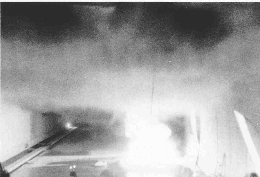
Bild 5. Seelisberg-Autobahntunnel, Brandversuche: Situation im Tunnel, 50 Sekunden nach Entzündung von 18 Litern Benzin