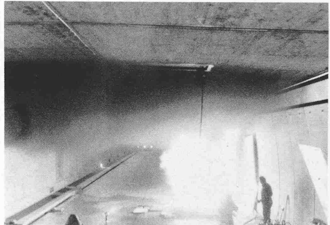
Bild 4. Seelisberg-Autobahntunnel, Brandversuche: Situation im Tunnel, 15 Sekunden nach Entzündung von 18 Litern Benzin