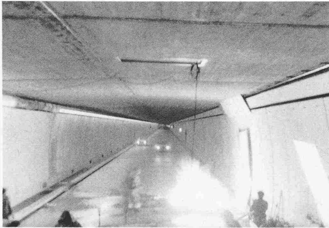
Bild 3. Seelisberg-Autobahntunnel, Brandversuche: Situation im Tunnel, 3 Sekunden nach Entzündung von 18 Litern Benzin