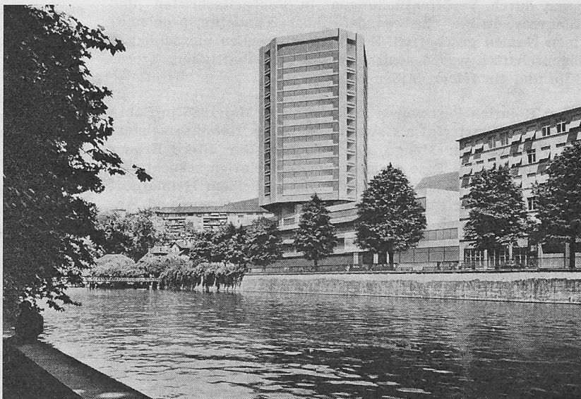
Hotelprojekt am Neumühlequai in Zürich, links aus Nordost, rechts aus Südwest (Standpunkt in den Platzspitz-Anlagen beim Landesmuseum). Architekt Werner Frey , Zürich