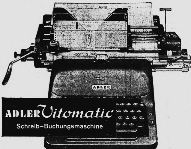
ADLER Vitomatic Schreib-Buchungsmaschine

Mit verbundenen Augen können Sie die Kontenkarte schreibfertig, zeilengerade und auf die richtige Buchungszeile einstellen. Kein Richten — ein Hebelzug genügt!