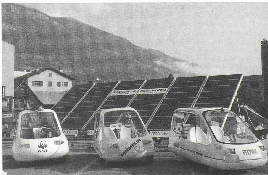
Fahrzeuge der Kategorie «Seriensolarmobile im Netzverbund» vor einer Solartankstelle

(Soll: gemäss Probeentnahme-Schlüssel vom Januar 1985.)