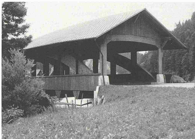
Bild 2. Strassenbrücke in Eggiwil

bringen. Hochbeanspruchte Enddiagonalen von Fachwerken beispielsweise müssen folglich nicht mehr in übergrossen Querschnitten oder sogar in Stahl ausgeführt werden, sondern lassen sich schlanker und konstruktiv einfacher in Brettschichtholz aus Buche ausbilden.