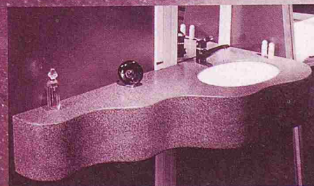
für Individual- lösungen von Grossabnehmern