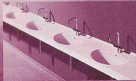
im Sanitärbereich öffentlicher Bauten

VARICOR® lässt anspruchsvolle Innenraumgestaltung leben. Ein vielseitiger High Tech Mineralwerkstoff für exklusive, hochwertige, moderne und farbenprächtige Lösungen. Flexibel in der Planung. Einfach in der Verarbeitung. Praktisch im täglichen Gebrauch. VARICOR® findet in den verschiedensten Segmenten Anwendung, z.B.