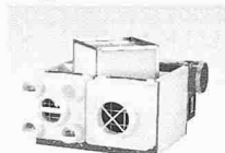
ABB Ventilatoren mit WRG

Mit Zeitautomatik. Formschön. 230 V 80 m 3 /h 300 Pa. Auch in AP-Ausführung. CE- konform. Von ANSON