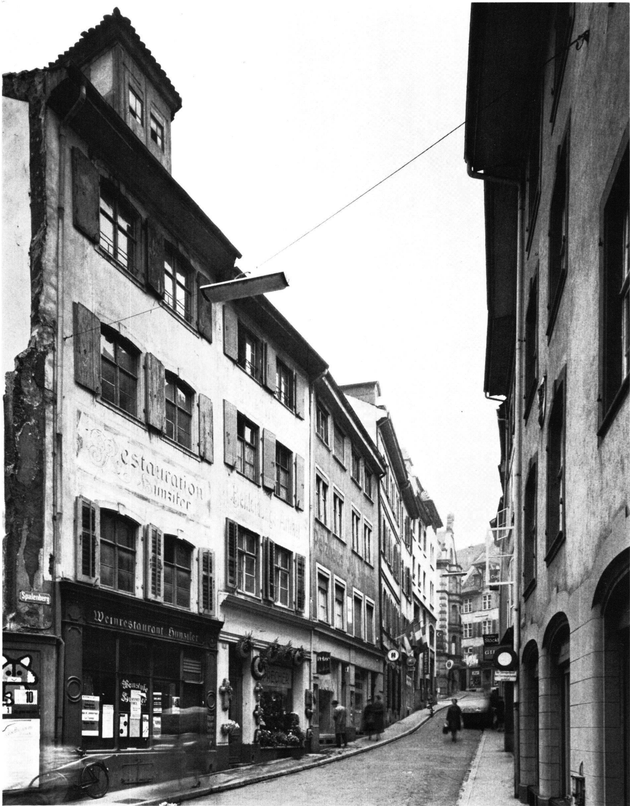
Abb. 1 Das Haus Spalenberg 5 in Basel, sogenanntes «Grünes Haus»; abgebrochen 1966. Wohnhaus und Besitz von Hans Herbst von 1501 bis 1535 (im Bild Haus ganz links)