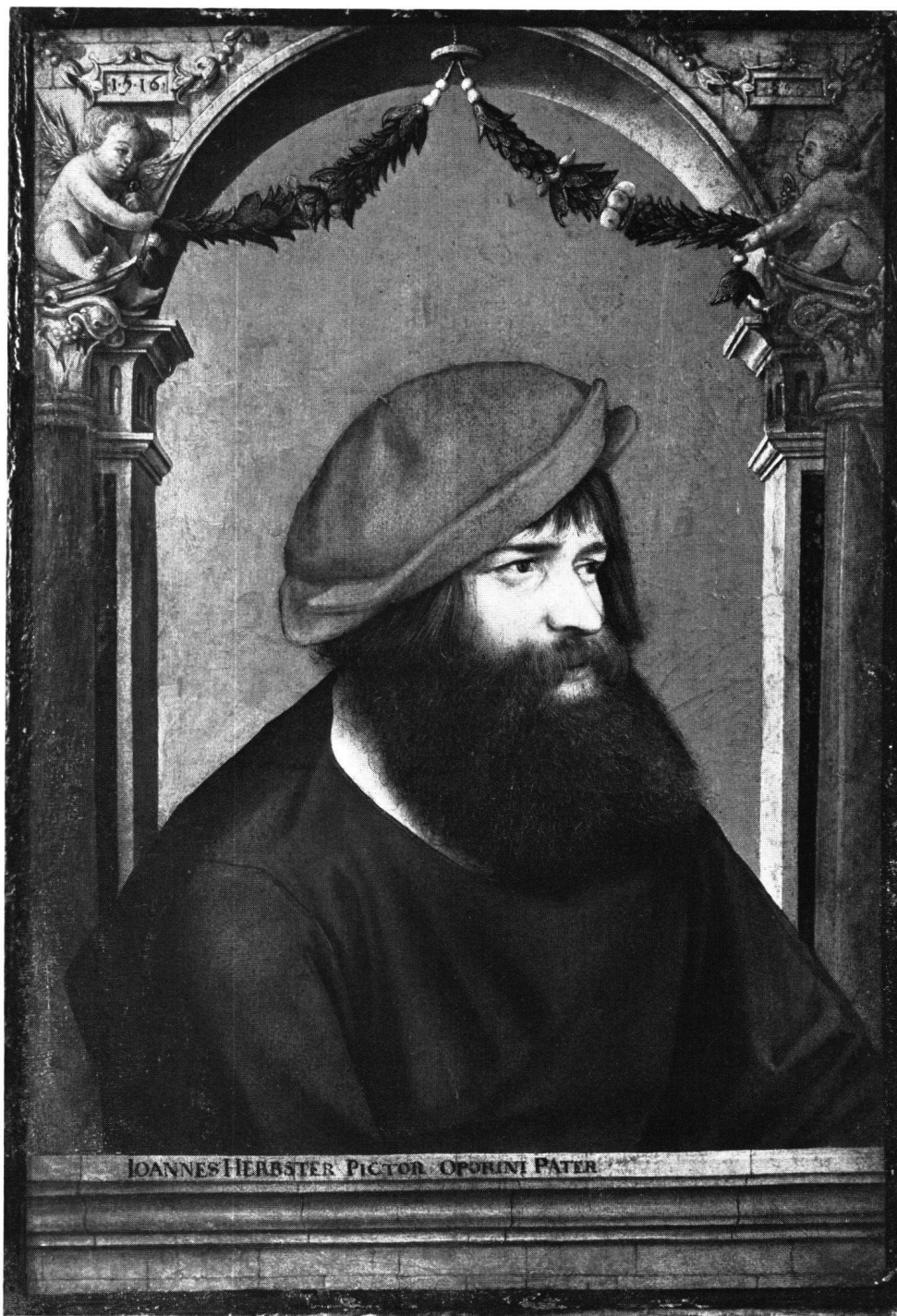
Abb. 5 Bildnis des Malers Hans Herbst, 1516. Ambrosius Holbein zugeschrieben (Öffentliche Kunstsammlung Basel, Inv. Nr. 293, Depositum der Gottfried-Keller-Stiftung)

enpfieng ich selb jn biwesen jrß wirdigen vatterß [= 26. Aug. 1519]. Jtem aber hab ich empfangen von der wirdigen muter priorin 26 vi gulden uff zinstag vor Sanct Frenen tag [= 30. Aug. 1519]. [Jtem] uff mentag vor des Heligen Crütz tag iii gulden, bracht mir Heinrich ir diener [= 12. Sept. 1519].