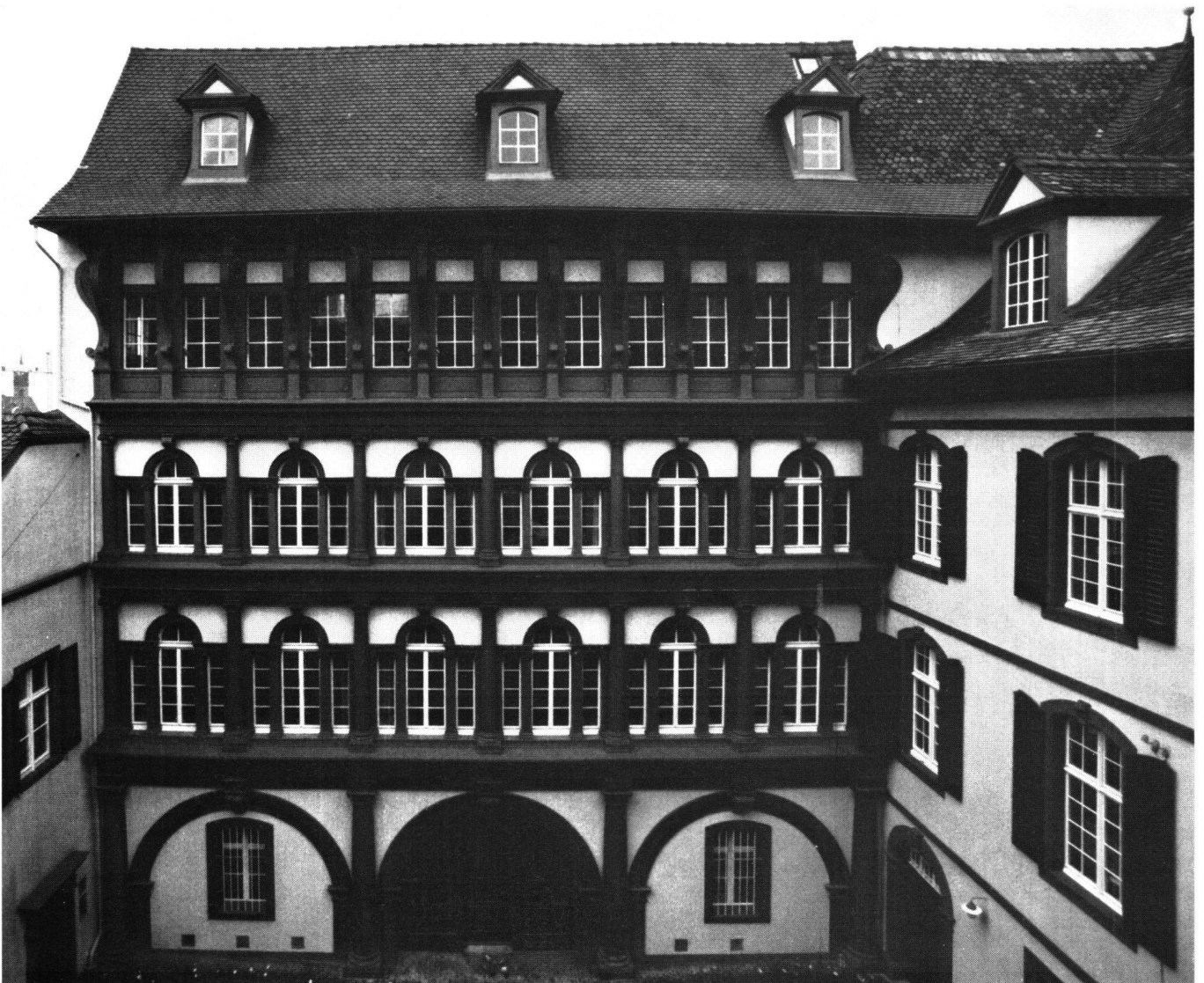
Abb. 1 Basel, Heuberg 7, Spießhof, Spätrenaissancefassade mit Barockbau

Bei der Geltenzunft ist die Quellenlage insofern ungünstig, als die Baurechnungen ganz summarisch geführt sind und keiner der bei der Umgestaltung des Baukomplexes und an der Errichtung der neuen, einheitlich gestalteten Fassade beteiligten Meister namentlich erwähnt wird. Zum Spießhof gibt es zwar keine Bauakten und Baurechnungen, hingegen einen ungewöhnlich großen Bestand an Hausurkunden, die bis ins 14. Jahrhundert zurückgehen. Deren Quellenwert besteht in der guten und dichten