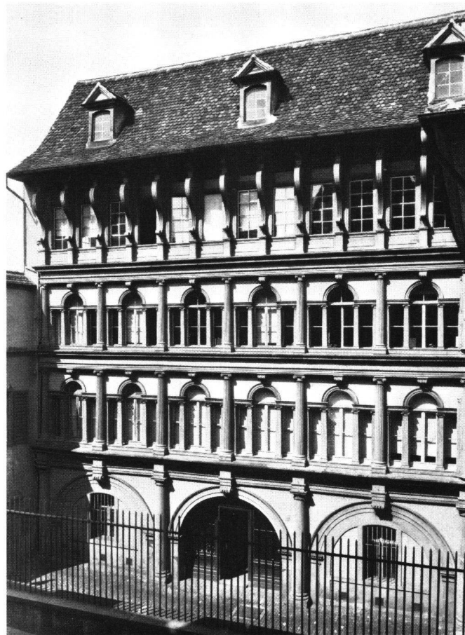
Abb. 4 Basel, Heuberg 7, Spießhof, Spätrenaissancefassade