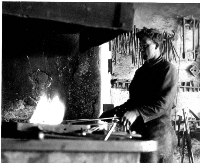
Das Eisen wird zum Fertigpassen ins Feuer gelegt und in die genaue Form geschmiedet

Verändert ist das Bild unserer Strassen seit Elektrizität und Motor unsere Verkehrswertzeuge bewegen. Nur selten begegnen wir in den Strassen der Stadt einer Pferdewirtschaft. Sie erscheint uns als ein Überbleibsel alter guter Zeit. Wir müssen schon aufs Land gehen, um hier bei der Feldbestellung, auf der Landstrasse diesen treuen Begleiter des Menschen noch weiter zu finden und zu beobachten. Aber auch hier hält die neue Zeit, hält der Traktor, hält die Elektrizität ihren Einzug und sucht das alte von seinem Platze zu verdrängen. Die Hufe schmiedefabrik, die einstmal die Grundlage des Schmiedehandwerkes war und deren Betrieb in guten Gegenden wirklich „einen goldenen Boden“ besaß, ist durch die Neuordnung der letzten Jahrzehnte auch zurückgebrängt worden. Wir erinnern uns aber noch alle gerne der Zeit, wo wir auf dem Lande vor der offenen Schmiede standen und sahen, wie Gila, Ufa oder Fanna zum Beschlagen geführt wurden, wie das Pferd angebunden wurde und dann die Arbeit des Schmiedes begann: das Abnehmen des alten, schadhaften Eisens, wenn es nicht