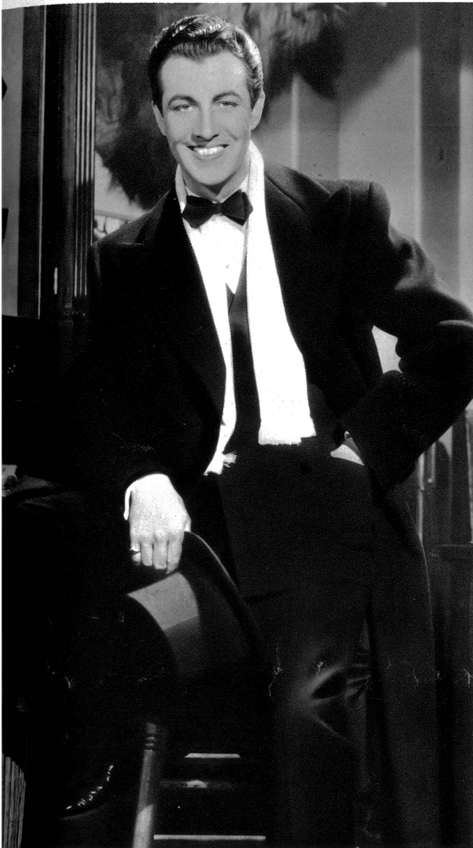
Robert Taylor . . . der neueste Weltstar! Ueber Nacht berühmt geworden, ist er heute der Liebling aller Frauen und wird in der kommenden Saison in verschiedenen Metro-Goldwyn-Mayer Filmen auftreten.

sagte, hat sich inzwischen erfüllt; und zumal für eine in früherer Zeit als hoffnungslos geltende Erkrankung des Zentralnervensystems: das Lähmungsirresein oder die Paralyse, fälschlich auch „Gehirnerweichung“ genannt, hat die moderne Medizin auf diese Weise ein wirksames neues Behandlungsverfahren geschaffen. Schon im Laufe des vorigen Jahrhunderts war es aufgefallen, daß gewisse Formen von Geistesverwirrung und Irresein eine bedeutende Besserung erfuhren, wenn etwa die Kranken irgend einen Zufall von einer mit hohem Fieber einhergehenden Ansteckungskrankheit befallen wurden. Bereits 1848 erschien ein derartiger Bericht in Bonn und 1864 ein ähnlicher in Rostock; aber erst der neueren Zeit blieb es vorbehalten, aus diesen Zufallserfahrungen planmäßig ein klinisch brauchbares Behandlungsverfahren der furchtbaren Paralyse abzuleiten. Der Wiener Psychiater Julius Wagner-Jauregg war es, der zum ersten Male den Schritt von der Theorie zur Praxis wagte und Kranke, die an der Paralyse litten, bewußt mit fiebererzeugenden Mitteln behandelte.