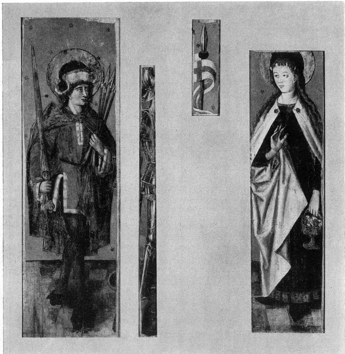
Abb. 2. Chur. Die Fragmente von der Werktagsseite nach der Freilegung