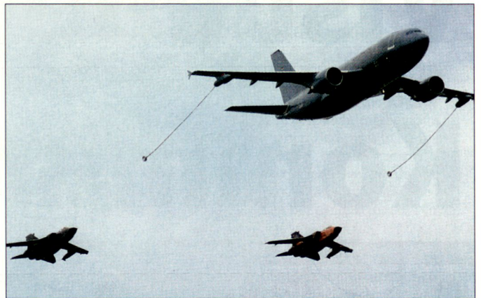
Auch die deutsche Bundeswehr schafft eigene Fähigkeiten zur Luftbetankung.

Mit der Verbindung von Langstreckentransport und Luftbetankung beschreitet die Deutsche