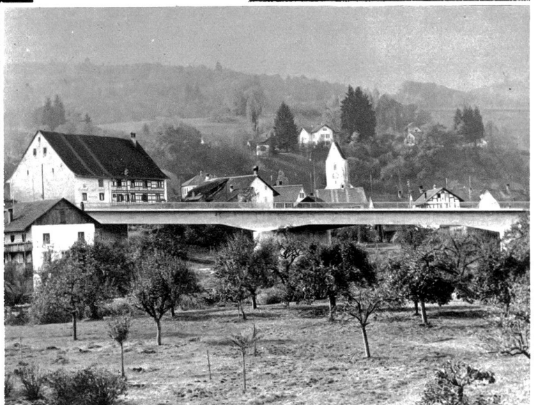
Die Landschaft baut Verkehrsbrücken. Eine vorbildliche Verkehrsbrücke über die Töss ist in Rorbastfreienstein ihrer Zweckbestimmung übergeben worden. Die Brücke mit ihrer breiten Fahrbahn, genügt modernsten Verkehrsanforderungen.