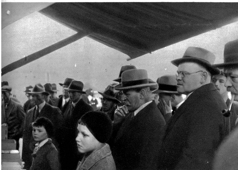
Andächtigt wird dem billigen Jakob zugesehen

Leute auch nicht verstanden. Aufgepaßt! Hier habe ich ein Notizbuch, — da könnt ihr eure Hypothekenschulden hineinschreiben. Und wenn ihr sie hineingeschrieben habt, dann müßt ihr sie schön zusammenrechnen und das Blatt herausreißen und in die Mäse werfen — das ganze Glump ist dann bezahlt!