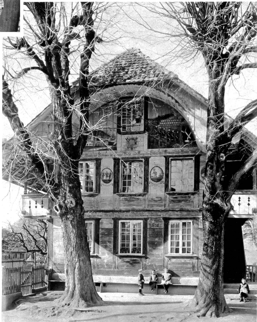
„Stöckli“ in Niederscherli

Der bernische Heimatschutz hofft in genannter Weise nach und nach die meisten der über 100, auf das ergangene Rundschreiben an die bernischen Gemeinden angegebenen Häuser, die der Renovation in Malereien und Architektur bedürftig sind, wieder in ansehnlichem Gewande erstehen zu sehen. Weil dabei jeweilen nach Tunlichkeit die Maler und Zimmerleute der betreffenden Gegenden herangezogen werden, so erwartet er dazu ein allseitiges Entgegenkommen von Seiten der Hausbesitzer und Gemeinden.