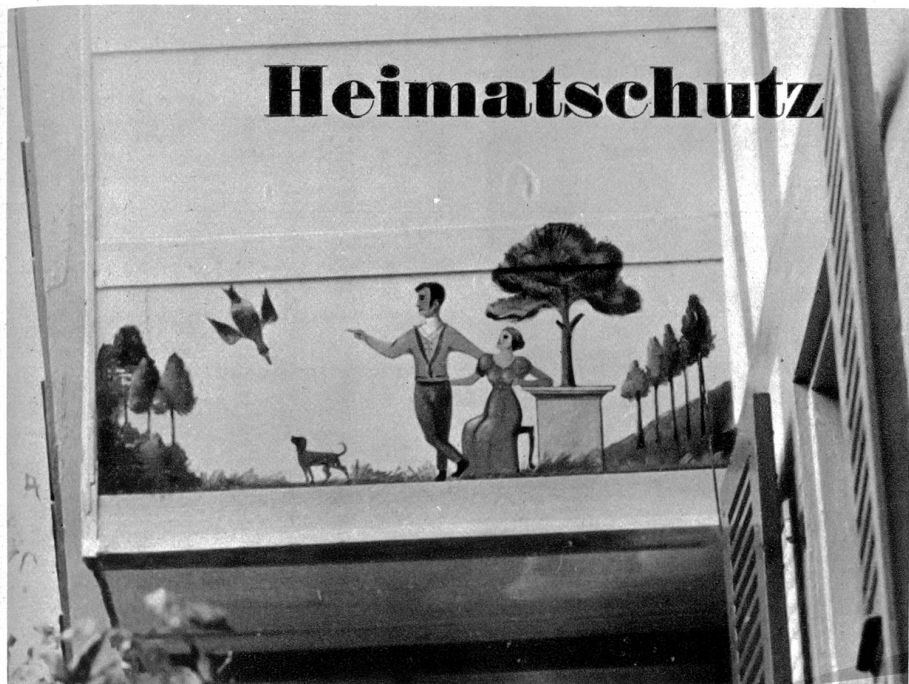
Bemalte Ründe am „Löwen“ in Bangerten