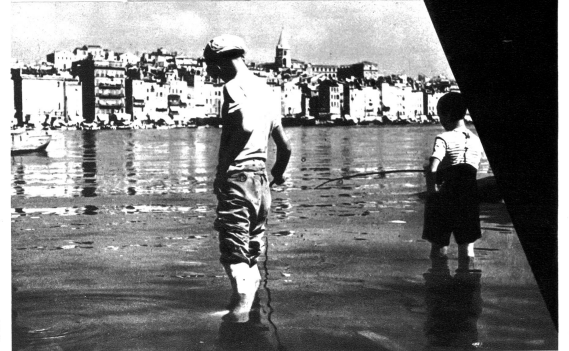
Marsellaner Buben sorgen für Masters Pfanne