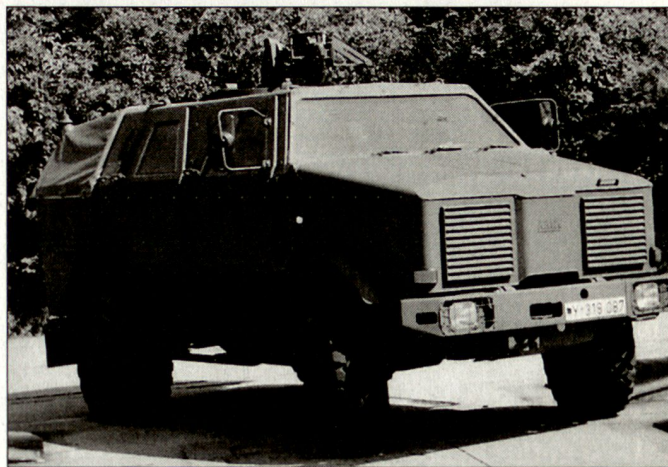
Erneuter Beschaffungsauftrag für das Allschutzfahrzeug «Dingo».

«Dingo 2» beschlossen. Die diesbezügliche Bestellung ging an den deutschen Rüstungsproduzenten Krauss-Maffei Wegmann. Der Auftragswert beläuft sich auf rund 170 Mio. Euro. Darüber hinaus wurde eine Option für die Beschaffung