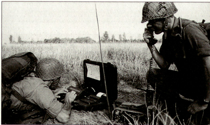
Bereits ab 2006 wird der Grundwehrdienst im österreichischen Bundesheer nur noch sechs Monate betragen.

Mit Ausnahme der zeitlich vorgezogenen Reduktion des Grundwehrdienstes handelt es sich bei den präsentierten Massnahmen um konkrete Empfehlungen der Bundesheer-Reformkommission vom letzten Jahr. Trotz der noch laufenden Diskussion kann davon ausgegangen werden, dass die Reform 2010 in Österreich umgesetzt wird, wobei die Schliessung von 40% der bisherigen Truppenstandorte am schwierigsten durchzusetzen sein wird. hg