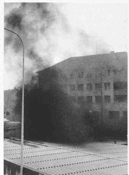
Bild 6. Abruggtunnel Zürich, Brandversuche: Austritt des Rauchs aus dem mit Gittern überdeckten Tunnelende