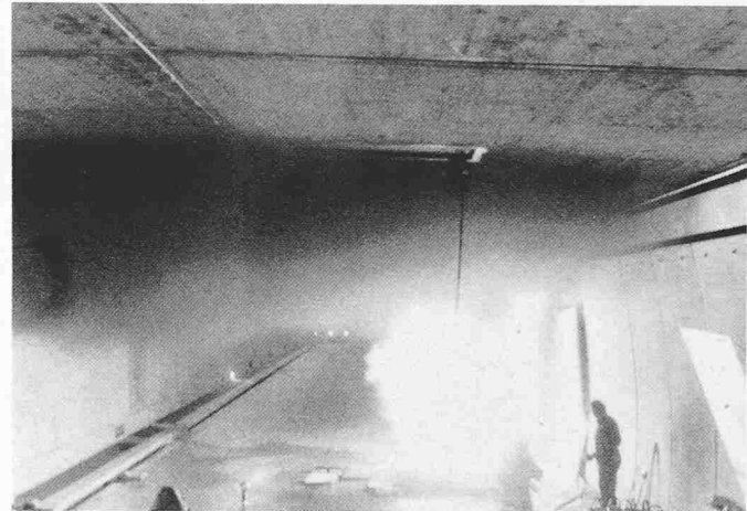
Bild 4. Seelisberg-Autobahntunnel, Brandversuche: Situation im Tunnel, 15 Sekunden nach Entzündung von 18 Litern Benzin