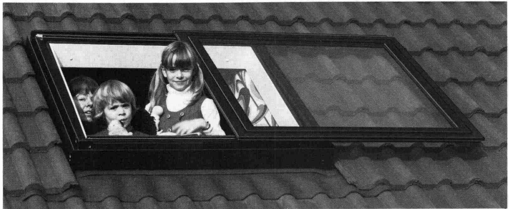
Das Braas-Atelierfenster lässt den Sonnenschein herein.

Zum behaglichen Wohnen in einem Dachraum gehört das Tageslicht, der freie Ausblick zum Himmel und in die Natur. Aber versuchen Sie einmal, die Sonne so richtig hereinzulassen, wenn sich das Dachfenster nur bis zu einer bestimmten Öffnung hochkippen lässt. Oder wenn schon, wie klappen Sie ein ganz aufs Dach hochgelegtes Fenster wieder mühe-los zurück?