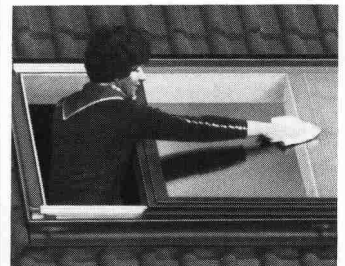
Beim Braas-Atelierfenster problemloses Reinigen auch der Fenster-Aussenseite.