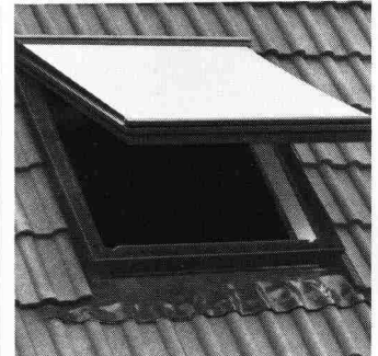
Reichhaltiges Zubehör: Rollos, Jalousetten oder Markisen.

Die eloxierten Aluminiumteile und der durchgefärbte Hart-PVC sind absolut witterungsbeständig und rostfrei. Zur Auswahl stehen 8 verschiedene Fenstergrössen und Verglasung nach Wunsch: Sonnenschutz-, Sicherheits-, Isolier- oder Thermopluglas.