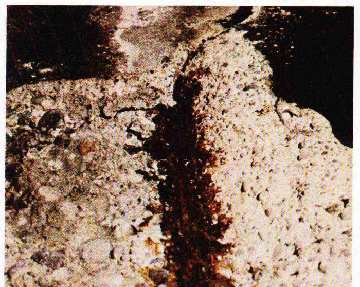
Brücke C. Die Stahleinlage von 30 mm Durchmesser besteht nur noch aus Eisenoxid!