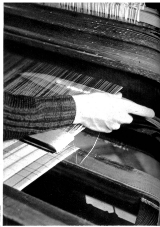
Ric-rac — fährt das Schiffchen husch—husch durch die Fäden

Arbeiten zuzuge gebracht. Längst wird das „Stiefel“, wie der Webstuhl in unsern Bergen heißt, nicht mehr für den Selbstgebrauch allein gebraucht, nein, man trachtet darnach, durch die geübte und solide Hand- und Kunstarbeit die maschinellen Teppiche und Vorhänge zu verdrängen. Und wer einmal die feinen, künstlerisch hochwertigen Muster betrachtet hat, der wird daran seine helle Freude finden. Hier ist's ein schmuder Vorleger, da der Leberzug zu einem Kissen, hier ein originelles Tischstud, das uns entzückt, in jenem