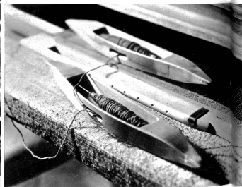
Die „fährigen“ Geister des Webstuhles, die Schiffchen

Arbeiten zuzuge gebracht. Längst wird das „Stiefel“, wie der Webstuhl in unsern Bergen heißt, nicht mehr für den Selbstgebrauch allein gebraucht, nein, man trachtet darnach, durch die geübte und solide Hand- und Kunstarbeit die maschinellen Teppiche und Vorhänge zu verdrängen. Und wer einmal die feinen, künstlerisch hochwertigen Muster betrachtet hat, der wird daran seine helle Freude finden. Hier ist's ein schmuder Vorleger, da der Leberzug zu einem Kissen, hier ein originelles Tischstud, das uns entzückt, in jenem