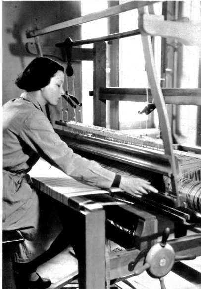
Studie am Webstuhl

Und was haben unsere Handweberrinnen, denn zur Hauptfache pflegen doch die Frauen dieses Kunstgewerbe, nicht für herrliche