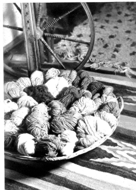
Wolle — Ausgangsstoff für die schmucken Webarbeiten

Zimmer sind's die Vorhänge und sieb' nur an: selbst die dicken Kleider der Hausfrau sind aus handgewebten Stoffen hergestellt.