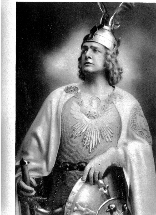
Kammersänger MAX HIRZEL als Gast. (Bild links)