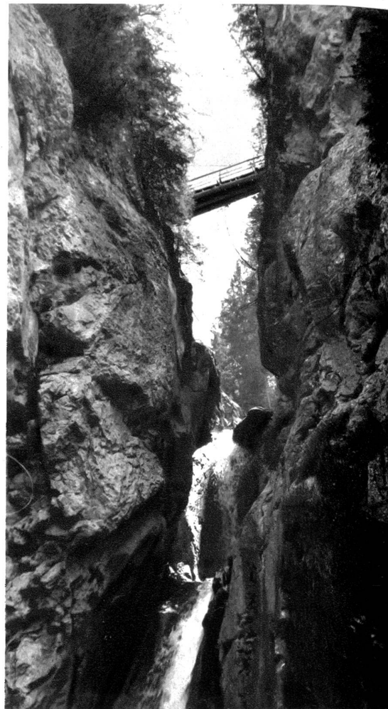
Gsteig bei Gstaad. Burgfälle. Arvenbrücke