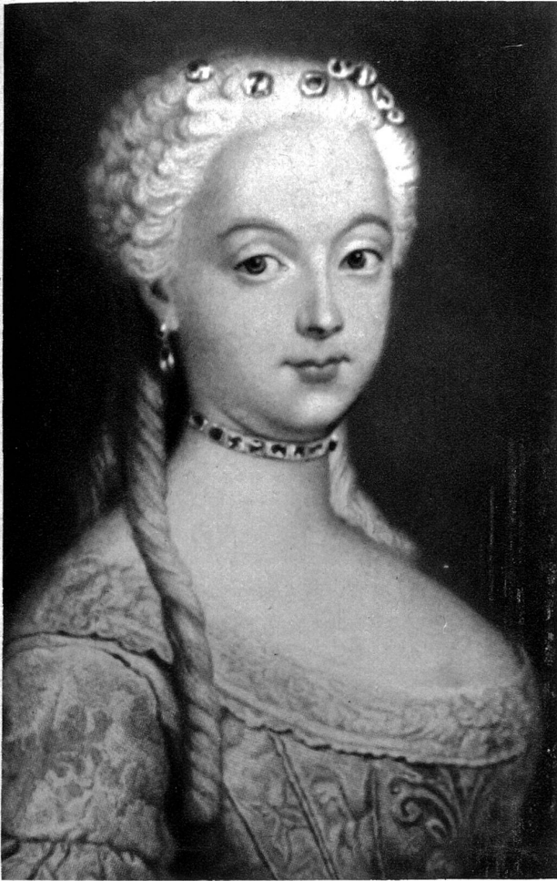
Prinzessin Amalie, Schwester Friedrichs des Grossen, die mit dem Gardeleutnant Freiherrn von der Trenck (Bild rechts) Herzensbeziehungen verbanden. Fast zehn Jahre musste er deshalb im Kerker verbringen.