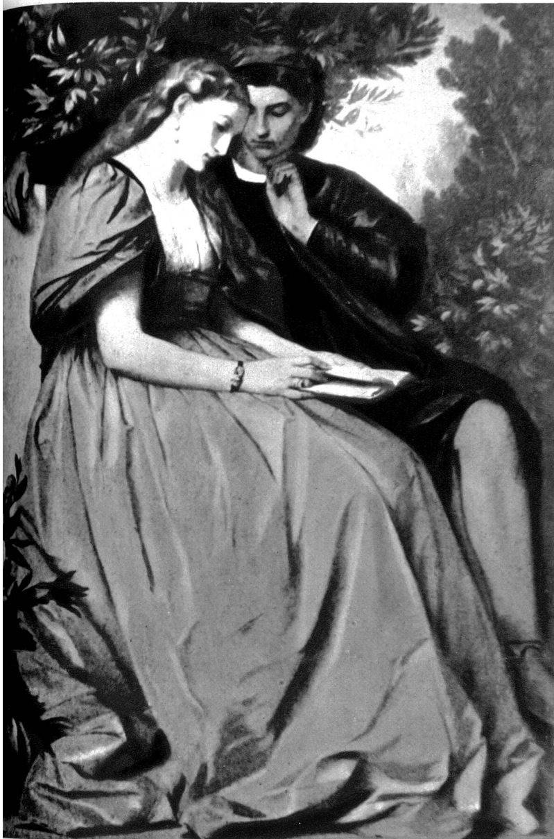
Francesca da Rimini und Paolo Malatesta, das durch Dantes „Göttliche Komödie“ berühmt gewordene Liebespaar (Gemälde von A. Feuerbach)