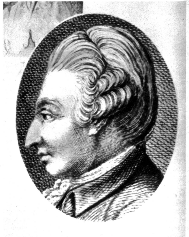
Gemälde von H. Grevedon